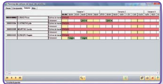
planning des rythmes de travail

La saisie sous forme de planning offre à l'utilisateur le confort et la convivialité d'un outil adapté aux besoins de l'entreprise.